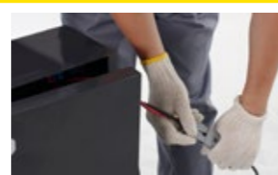
充電して使えます バッテリー式