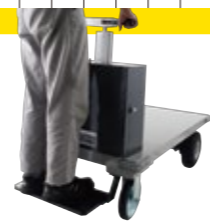
乗車できます AUTO TWIN-02オプションのみ