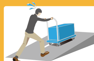
勾配のある路面に 対象: AUTO SUPER TWIN-2