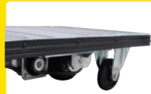
電動で走行します モーター走行